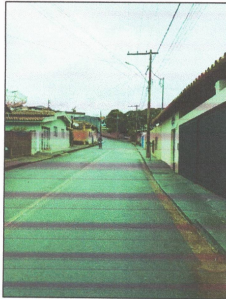
Foto 2 – Rua Antero Teófilo Machado, Centro – necessidade quebra-molas